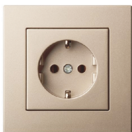
-ramka standard szampański

Przykładowe kompozycje z różnymi ramkami: