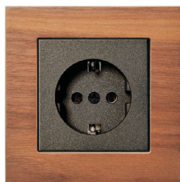
-ramka wood nut