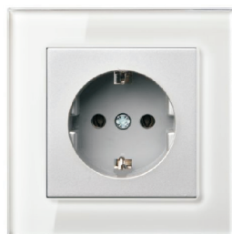
-ramka glass milk

*Wszystkie kompatybilne ramki dostępne w oddzielnej karcie katalogowej.